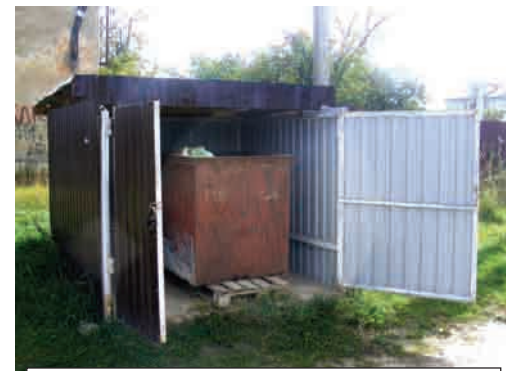
Так выглядит частная контейнерная площадка, расположенная по 1-му Красногвардейскому переулку.

Летом частники вызывали машину чаще, чтобы избежать появления специфического запаха вокруг контейнера. Платить, конечно,