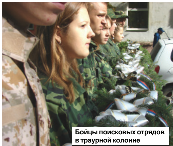
Бойцы поисковых отрядов в траурной колонне