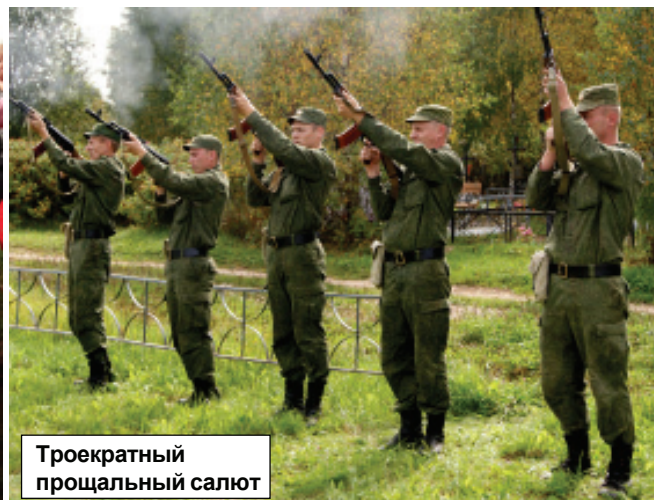
Троекратный прощальный салют