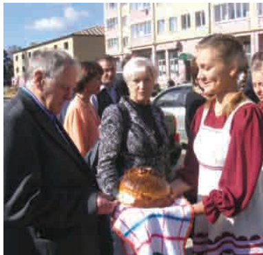
На каждом новоселье городского масштаба хлеб-соль - неперенный атрибут.