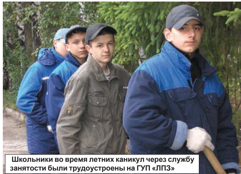
Школьники во время летних каникул через службу занятости были трудоустроены на ГУП «ЛПЗ»

Обратилось в центр занятости 14 несовершеннолетних граждан, состоящих на учете в ОДН Межмуниципального отдела МВД России «Ярцевский» и в комиссии по делам несовершеннолетних и их защите муниципального образования «Ярцевский район» Смоленской области. Из них 4 несовершеннолетних трудоустроено по Программе «Организация временного трудоустройства несовершеннолетних граждан в возрасте от 14 до 18 лет в свободное от учебы время». Двенадцати несовершеннолетним гражданам оказаны профориентационные услуги.