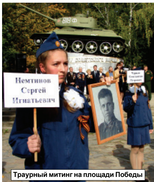
Траурный митинг на площади Победы